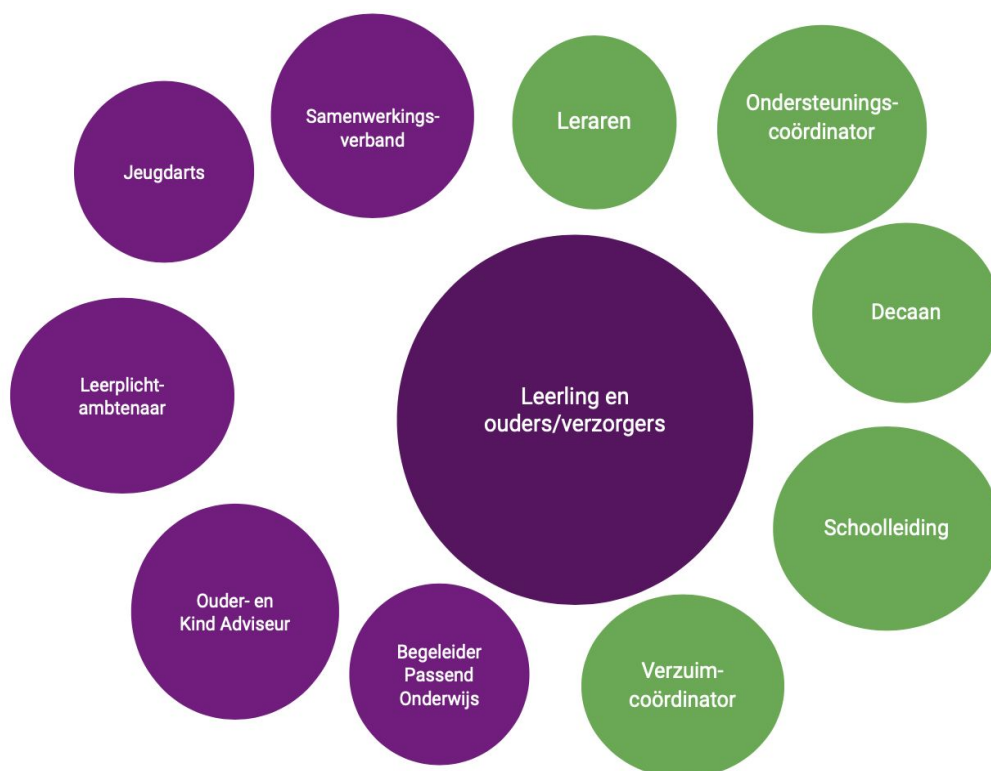
Figuur 2: betrokken medewerkers ondersteuningsstructuur DENISE

In figuur 2 staat weergegeven welke interne medewerkers onderdeel zijn van de ondersteuningsstructuur binnen DENISE (groen) en met welke externe partners (paars) er structureel wordt samengewerkt rondom de ondersteuning van leerlingen (en hun ouders/verzorgers).