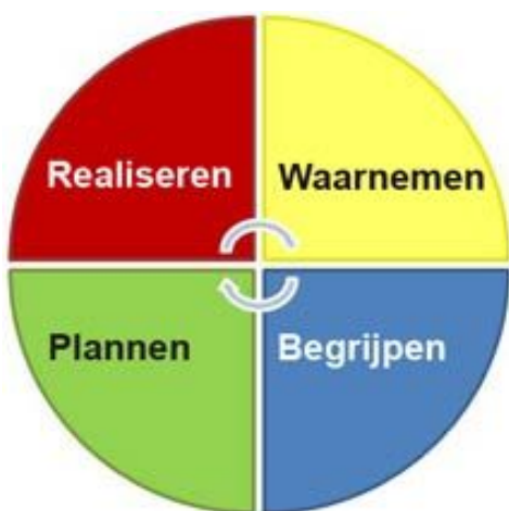
Figuur 3: de cyclus van ondersteuning

De leraar registreert deze cyclus in het leerlingvolgsysteem in een plan van aanpak/handelingsplan en zet deze in het leerlingvolgsysteem Parnassys (PO) of Magister (VO). De onderdelen die als 'notitie' in het leerlingvolgsysteem worden gezet, zijn in ieder geval: opvallende observaties, individuele gesprekken met leerlingen en een ouders-, leerling- en groepsbespreking.